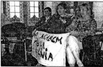
Petits i grans mostraren pancartes reivindicatives davant el Molí d'en Regalat per exigir que es mantingui tal com està.